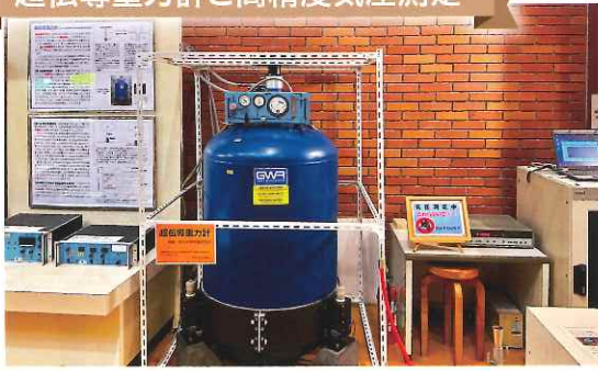
超伝導重力計と高精度気圧測定

館内外の水車・発電機などの実物展示を通して、水力エネルギー開発の歴史に想いを馳せ、エネルギーの流れについて考えてみる。そんなひとときを過ごしてみたいはいかがでしょうか？熱・光・運動・電気など様々なものになり変わり、直接見るのが難しいエネルギーですが、各種模型や実験装置などにより、エネルギーの基礎について楽しく学ぶことができます。